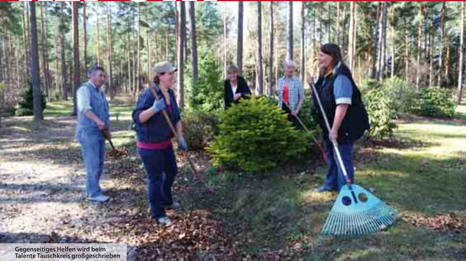
Gegenseitiges Helfen wird beim Talente Tauschkreis großgeschrieben